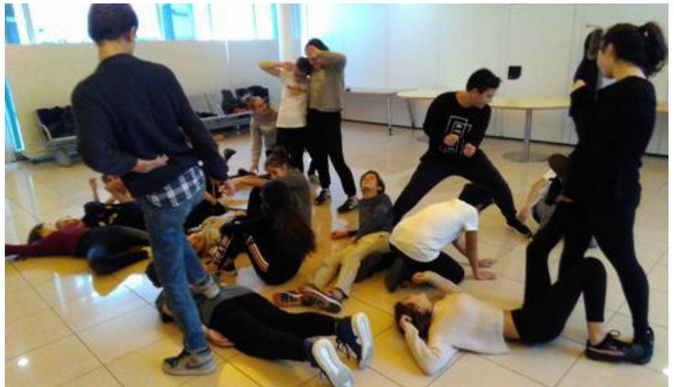
Attività di espressione corporea